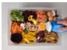
ILLUSTRATION : COMPOSTAGE De Élise Auffray - 2014 00:02:34 - France - Documentaire Musique : Paul Le Guyader Production : Faltazi Prod

Nous le savons, vous le savez, tout le monde le sait, il est temps (encore) temps de changer !